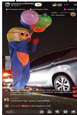
Gambar 3 Aksi live badut jalanan virtual dengan pemilik akun tiktok pejuang.nafkah08

Salah satu taktik pengemis digital untuk menarik perhatian audiens adalah dengan menampilkan diri secara unik, misalnya menggunakan kostum badut, manusia silver, superhero, atau karakter kartun. Penampilan ini dimaksudkan untuk memberikan kesan hiburan agar penonton terdorong untuk memberikan hadiah virtual sebagai bentuk apresiasi. Meskipun terlihat menghibur, praktik ini tetap mengandung unsur cyber begging karena fokus utamanya adalah meminta gift atau donasi, bukan murni memberikan hiburan berkualitas. Fenomena ini juga menimbulkan pergeseran nilai kerja keras karena lebih mengandalkan rasa iba penonton daripada keterampilan atau karya nyata. Contohnya: