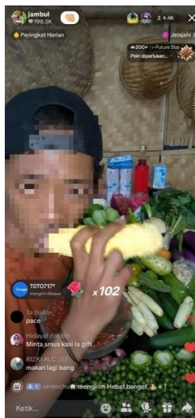
Gambar 4. Aksi Live makan sayur mentah oleh pemilik akun TikTok jambul

Salah satu bentuk konten yang memprihatinkan dalam praktik cyber begging adalah aksi yang mengarah pada eksploitasi diri sendiri. Konten semacam ini biasanya menampilkan tindakan ekstrim atau tidak wajar, yang dilakukan semata-mata untuk menarik perhatian penonton dan memperoleh gift atau donasi. Contohnya adalah aksi makan sayur mentah dalam jumlah banyak atau dengan cara yang tidak lazim. Aksi seperti ini kerap dimasukkan dalam kategori konten memprihatinkan karena memperlihatkan upaya eksploitasi diri sendiri untuk menarik simpati atau perhatian publik. Tindakan tersebut seringkali membahayakan kesehatan atau martabat pelaku, namun tetap dilakukan demi mendapatkan keuntungan finansial secara instan melalui platform live streaming .