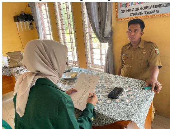
Gambar 1. Wawancara dengan Pemangku Adat Suku Lampung

Penelitian ini menunjukkan bahwa Piil Pesenggiri, nilai budaya lokal Lampung, mengandung unsur moderasi beragama seperti keseimbangan, toleransi, dan saling menghormati 17 . Piil Pesenggiri mengajarkan pentingnya hidup harmonis dalam masyarakat beragam dengan menghargai setiap individu tanpa memandang latar belakang. 18 Di desa Khepong Jaya, wawancara dengan tokoh adat Bapak AH mengungkapkan bahwa nilai-nilai Piil Pesenggiri sangat dijunjung tinggi dan diterapkan dalam interaksi sehari-hari, sebagaimana dibuktikan dalam percakapan wawancara peneliti berikut, peneliti :”Bagaimana implementasi umat agama islam dan agama lainnya dalam melaksanakan piil pesenggiri (jelaskan perindikator piil pesenggiri )?”, tokoh pemangku adat : ”masyarakat menjunjung tinggi prinsip-prinsip piil pesenggiri dan menjalankannya”. Berikut dokumentasi dari wawancara dengan tokoh pemangku adat desa Khepong Jaya: