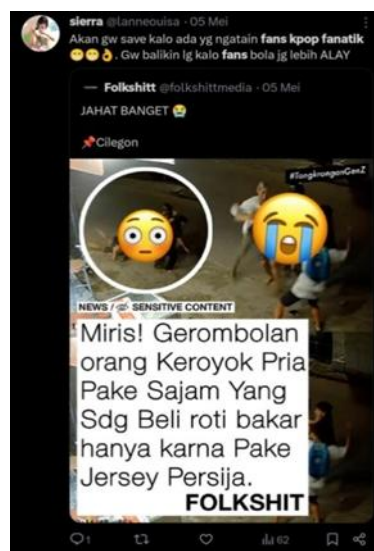
Gambar 2. Akun Twitter @tanyakanrl Gambar 3. Akun Twitter @lanneousia

Pada gambar 2 diatas menunjuk adanya sebuah perilaku israf yang sangat tidak terpuji dikarenakan terdapat sebuah komentar yang tidak baik, perkataan tersebut