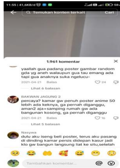
Gambar 1. Akun tiktok @Kpopchartofficial

Pada postingan diatas terdapat sebuah video yang menunjukkan adanya foto artis korea yang dipajang didinding kamar dan biasanya sering dikenal dengan sebutan K-pop, video tersebut menggambarkan tentang sebuah kefanatisme dalam mengidolakan sebuah tokoh sehingga membuat seseorang itu bisa dikatakan Israf . Seharusnya hal itu tidak dilakukan pada para penggemar yang mengidolakan dikarenakan bisa merusak kaidah keimanan pada diri seseorang dan hal itu bisa mengakibatkan seseorang keluar dari ajaran islam.