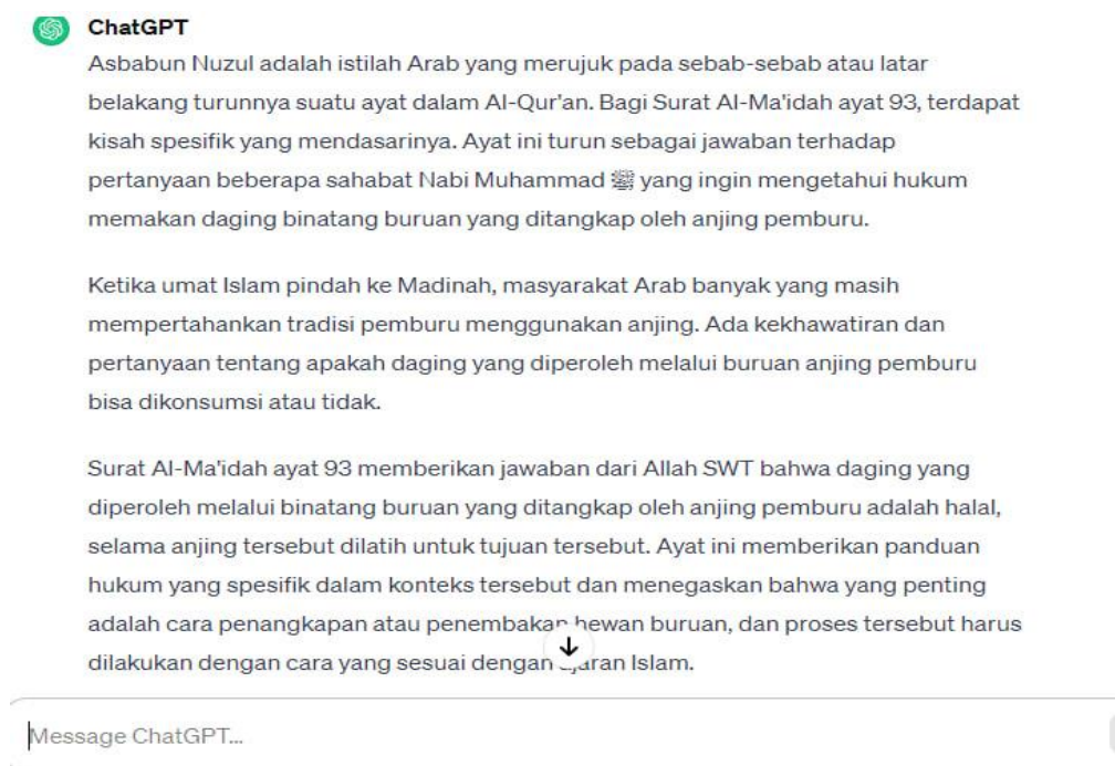
Gambar 2. Hasil ChatGPT Ketika Diminta Asbabun Nuzul

Sehingga, hasil penafsiran AI tidak bisa dijadikan rujukan yang pasti. Melainkan tetap harus berpacu kepada tafsir-tafsir yang sudah masyhur. Karena AI memang hanya menjelaskan sesuatu yang diperintah. Setelah kita melihat beberapa perbedaan di atas bahwasannya memang jelas bahwa teknologi AI tidak bisa menjadi rujukan tafsir seperti kitab-kitab tafsir yang sudah masyhur seperti Tafsir Ibnu Katsir dan Tafsir Al-Misbah.