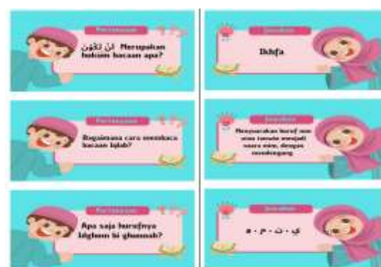
Gambar 1 Media Pembelajaran Couple Card