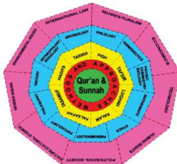
Gambar 1. Jaring Laba-Laba Keilmuan

Model integrasi ilmu yang dikembangkan UIN Sunan Kalijaga Yogyakarta menempati posisi tersendiri dalam peta epistemologi perguruan tinggi Islam Indonesia. Kampus ini memilih pendekatan yang dikenal sebagai model jaring laba-laba keilmuan, sebuah konsep yang banyak dipengaruhi oleh gagasan M. Amin Abdullah tentang integrasi-interkoneksi. Pendekatan ini tidak sekadar menyatukan ilmu-ilmu agama dengan ilmu umum, tetapi membangun hubungan multidimensi yang saling terkait antara seluruh disiplin ilmu. Skema jaring laba-laba yang diperkenalkan Abdullah menggambarkan posisi Al-Qur'an dan Sunnah sebagai pusat sekaligus poros hermeneutis yang memberi arah bagi seluruh cabang pengetahuan. Dari pusat ini, berbagai cabang ilmu alam, ilmu sosial, dan humaniora berjejaring dan saling menopang sehingga menghasilkan struktur pengetahuan yang bercorak teo-antroposentris integralistik: memadukan orientasi ketuhanan dengan kebutuhan manusia secara harmonis.