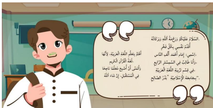
Gambar 1 : Vidio Edukatif

memberikan umpan balik langsung kepada peserta didik. Penggunaan video interaktif juga memungkinkan integrasi materi dengan situasi komunikatif yakni simulasi percakapan dalam bahasa Arab yang dapat dihentikan di titik tertentu untuk meminta respon siswa. Teknik ini tidak hanya memperkuat keterampilan berbahasa, tetapi juga menumbuhkan keberanian berbicara dalam bahasa target. Dari sudut pandang pendidikan, hal ini selaras dengan teori pembelajaran konstruktivis yang menekankan keterlibatan aktif peserta didik dalam membangun pengetahuan.