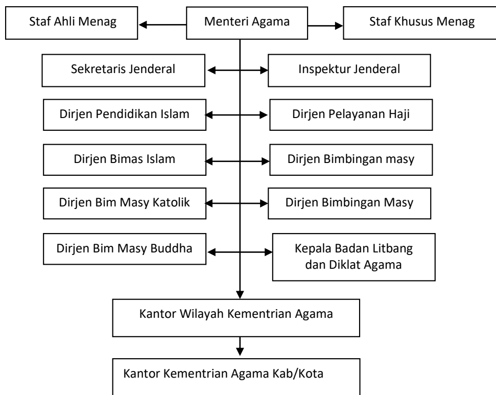
Gambar 1 Hierarki Birokrasi

masing-masing kelompok dan orang-orang dengan jelas melakukan tugas apa, kapan, dan bagaimana dilakukan. Misalnya pembagian guru bidang study( mata pelajaran, pembimbing), dilingkungan staf ada tugas-tugas yang khusus dalam hal keuangan, kepegawaian, perlengkapan dan sebagainya. Seluruh siswa sebagai peserta didik pun dikelompok-kelompokkan ke dalam siswa kelas I, II, dan III. Ada kelompok siswa kategori berprestasi, bermasalah, dan sebagainya. Dalam hal ini, penulis meneliti birokrasi di MA Sunni Darussalam yang terletak di Dukuh Tempelsasi Banjeng Maguwoharjo Depok Sleman Yokyakarta. MA Darussalam adalah salah satu unit pendidikan formal yang berada di bawah naungan yayasan Pondok Pesantren. Pesantren ini didirikan oleh almarhum Prof Dr.KH. Moh Tolchah Mansoer, SH, yang notabene pendiri IPNU (Ikatan Pelajar Nahdlatul Ulama).