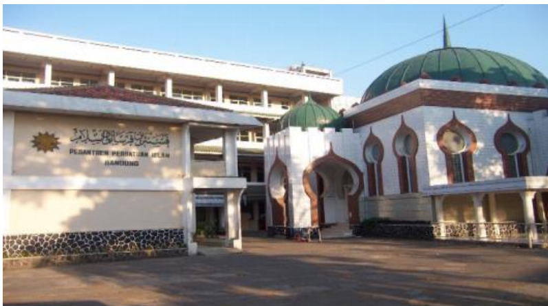
Gambar 1. Pesantren Persatuan Islam 1-2 Bandung

Pesantren Persatuan Islam 1 Bandung secara geografis terletak di Kota Madya Bandung, sebelah utara Pesantren dibatasi dengan jalan Karanganyar, sebelah timur jalan Pajagalan, sebelah selatan jalan Kalipah Apo, sedangkan rumah penduduk membatasi sebelah barat. Lembaga pendidikan ini termasuk berada di pusat kota berdekatan dengan pertokoan, greja dan lembaga pendidikan lainnya. Jam'iyah Persatuan Islam yang berdiri pada tanggal 12 september 1932, dan untuk merealisasikan dakwahnya, para ulama berinisiatif untuk berusaha membentuk suatu lembaga pendidikan Islam, oleh karena itu pada tanggal 1 Dzulhijjah 1354 bertepatan dengan 4 maret 1936, persis mendirikan sebuah pesantren yang di sebut "Pesantren Persatuan Islam".