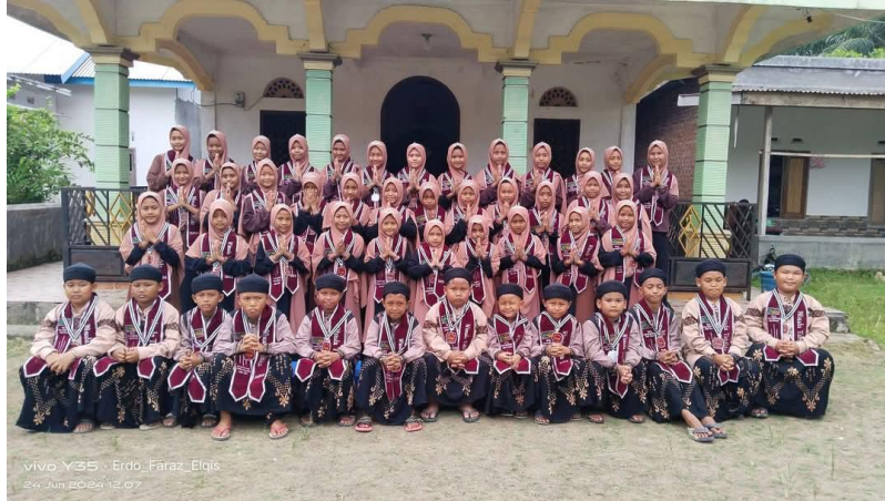
Gambar 2 Santri RTQ Daarul Mutaqin Kab Musi Rawas

nasional melalui pendidikan bahasa. Namun, guru juga diharapkan untuk tetap menghargai latar belakang budaya peserta didik dengan sesekali memasukkan elemen bahasa daerah yang relevan untuk menjaga rasa keterhubungan dan penghargaan terhadap budaya lokal.