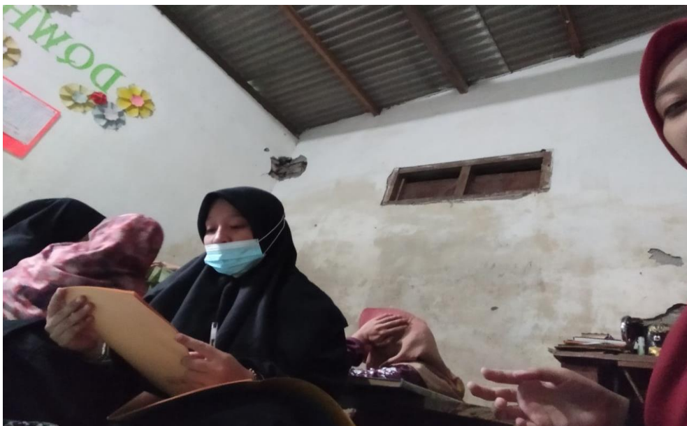
Gambar 3. Saat kegiatan mengaji kitab Fatkul Qarib di Pon. Pes. Darul Quro' Wal Huffadz