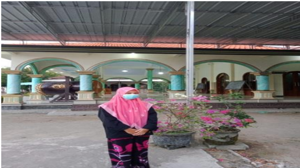
Gambar 1. Saat observasi lingkungan tempat pelaksanaan KKN-DR