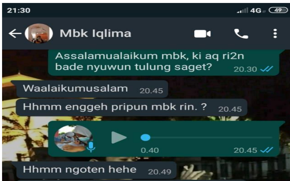
Gambar 4. Ketika mangajukan program kerja KKN-DR pada salah satu anggota