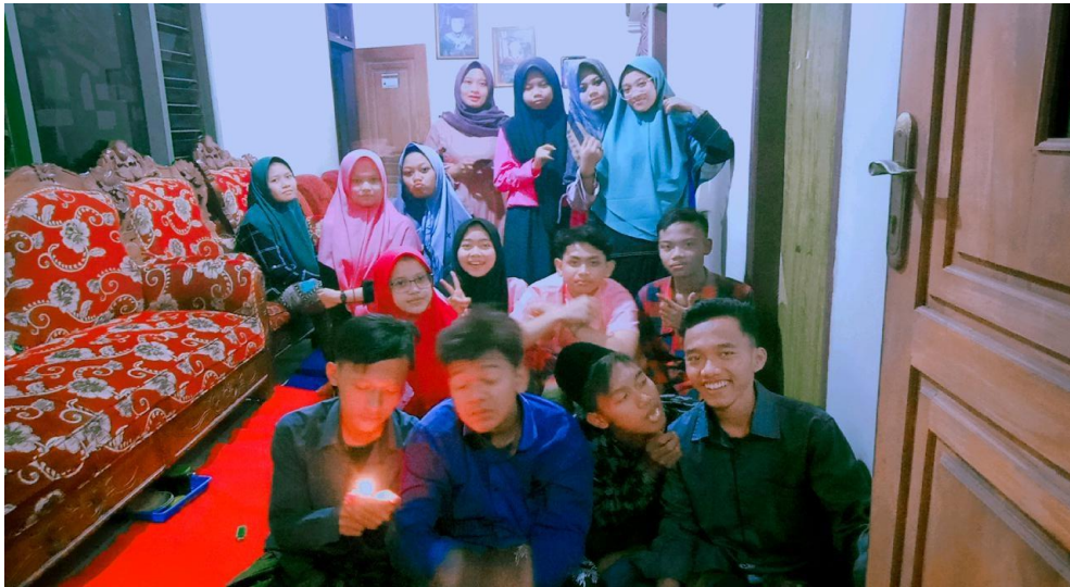
Gambar 5. Beberapa anggota IPNU-IPPNU

Dusun Ringinrejo Desa Tiru Lor Kecamatan Gurah Kabupaten Kediri