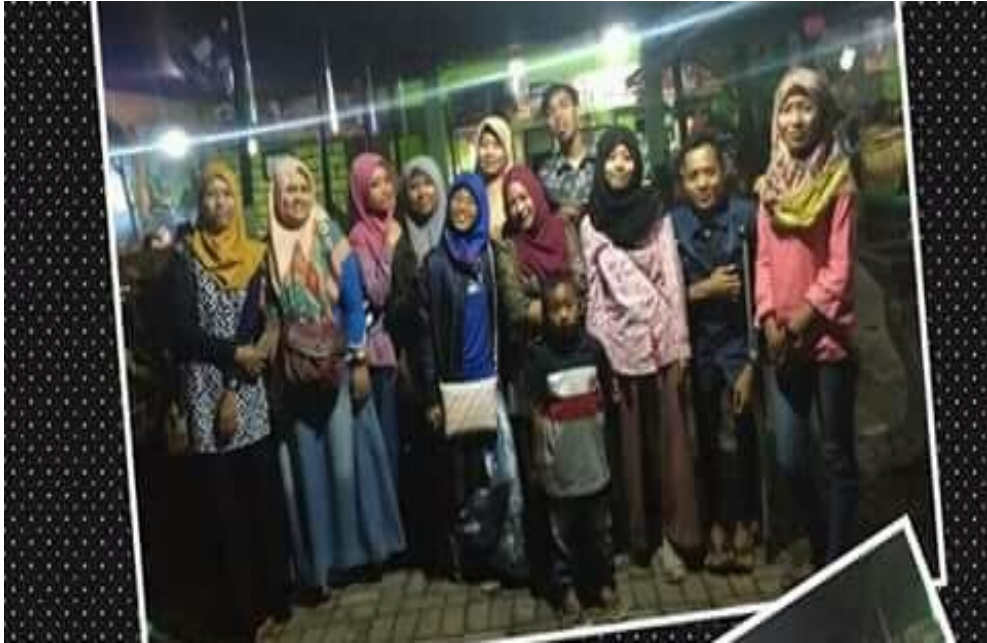
Gambar 7. Saat pelaksanaan sosialisasi dengan para pemuda Dusun Ringinrejo Desa Tiru Lor Kecamatan Gurah Kabupaten Kediri