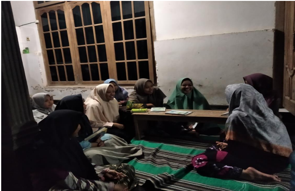
Gambar 8. Saat memberikan sosialisasi kepada para pemuda Dusun Ringinrejo Desa Tiru Lor