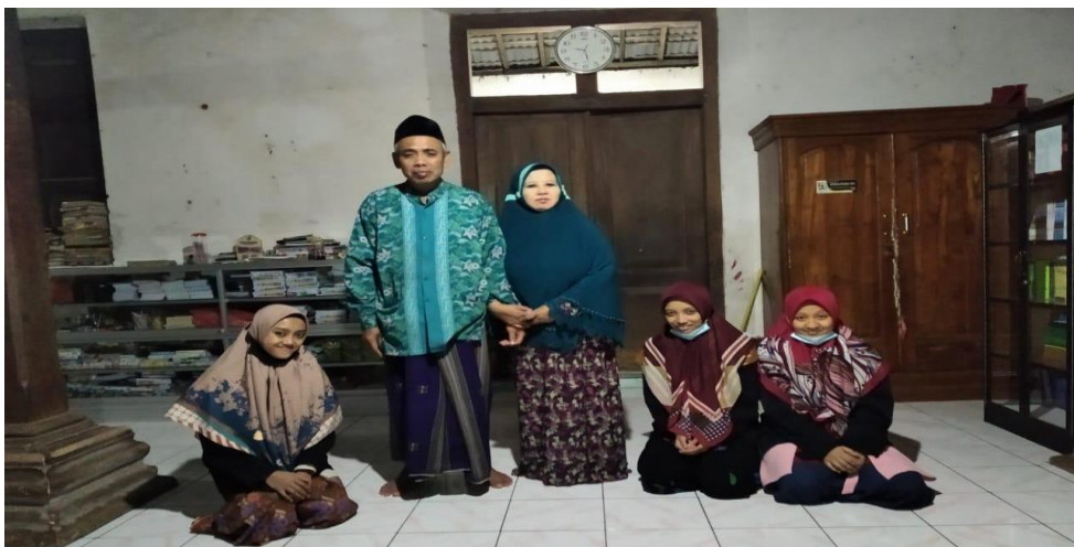
Gambar 2. Saat sowan ke pengasuh Pon. Pes. Darul Quro' Wal Huffadz