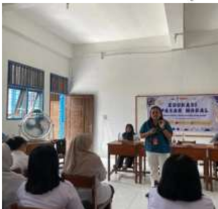
a. Perubahan Tingkat Pemahaman Literasi Keuangan dan Pasar Modal