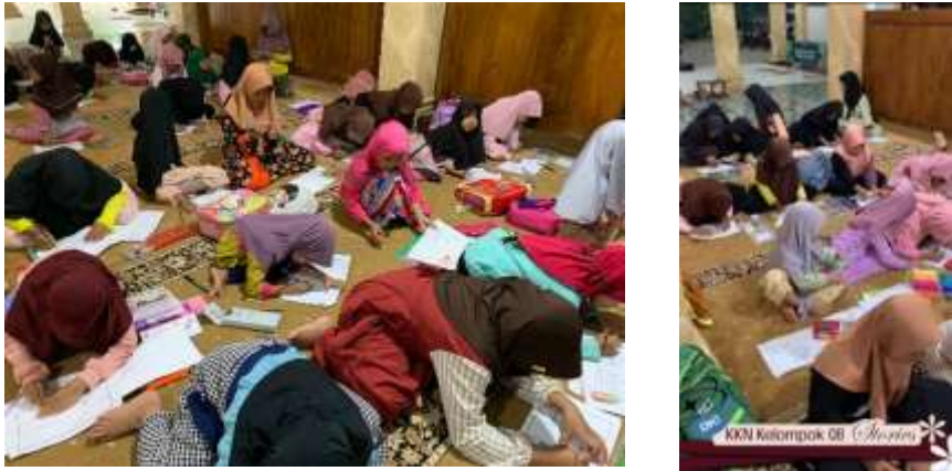
Gambar 4.a: Dokumentasi Peminatan Ekstra Kaligrafi