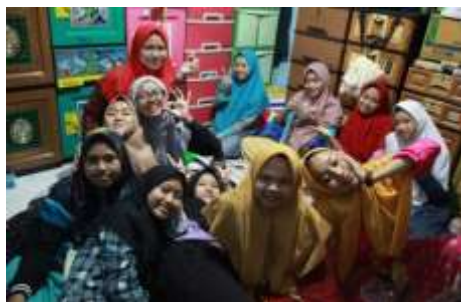
Gambar setelah kumpulan kamar