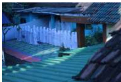
Gambar pemantauan jama'ah