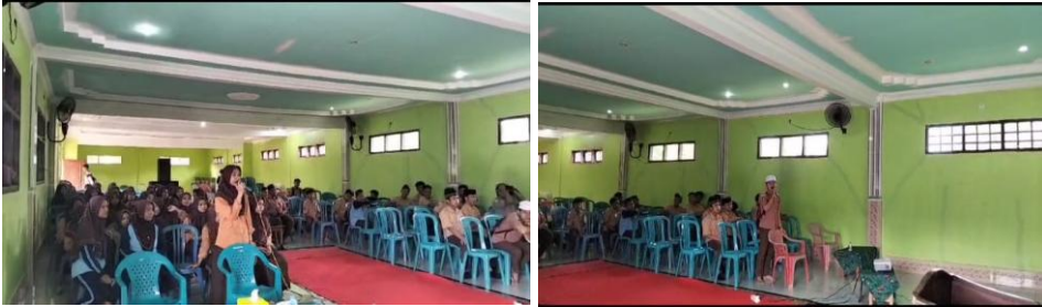
Gambar 6 : Sesi Tanya Jawab

Dalam pelatihan leadership ini Siswa MA Miftahul Ulum Sukaoneng sangat antusias mengikuti pelatihan dibuktikan dengan banyaknya siswa yang ikut berkontribusi dalam pelatihan serta keaktifan siswa di waktu sesi tanya jawab.