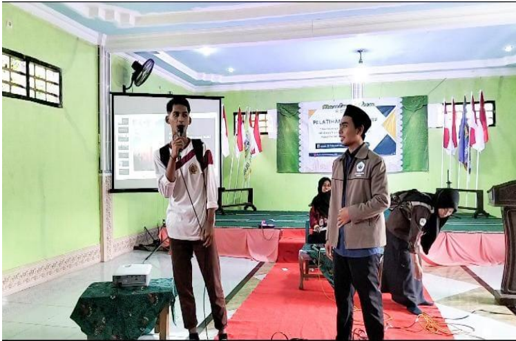
Gambar 2: Narasumber & Peserta Pelatihan

Materi mengenai Kepemimpinan menjadi sangat penting dikarenakan seorang pemimpin hadir untuk menjadi pengambilan keputusan. Pengambilan keputusan jadi bagian terpenting dalam kepemimpinan, apalagi ketika pemimpin sedang melaksanakan fungsi perencanaan untuk keberlangsungan organisasi .