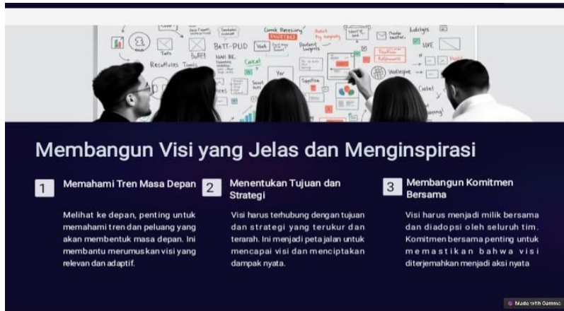
Gambar 4 : Materi Pelatihan

Membuat visi yang jelas adalah salah satu materi penting dalam pelatihan leadership. Visi yang jelas akan menjadi pedoman bagi seorang pemimpin dalam menjalankan berbagai program dan kegiatan organisasi. Dalam pelatihan tersebut, peserta didik diajarkan bagaimana cara merumuskan visi tidak hanya relevan sesuai dengan kebutuhan organisasi, akan tetapi juga bisa memotivasi semua anggota untuk bekerja sama dalam mencapai tujuan tersebut.