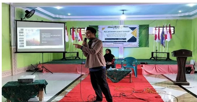
Gambar 1 : Narasumber memberikan materi tentang kepemimpinan kepada siswa

Saat ini, tantangan dalam kepemimpinan menjadi isu yang sangat mendesak, sehingga muncul fenomena krisis kepemimpinan yang disebabkan oleh menurunnya kepercayaan. Salah satu untuk mengatasinya adalah dengan menghasilkan individu yang kompeten untuk yang menjabat sebagai pemimpin (yohana et al, 2023).