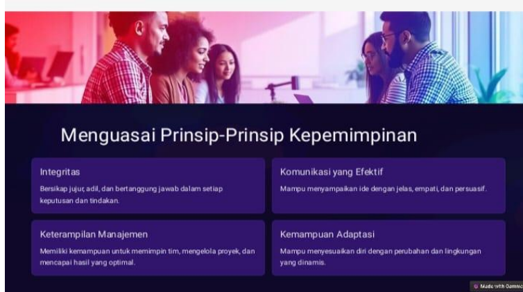
Gambar 3 : Materi Pelatihan

percaya dirinya, dan belajar cara mengelola emosi dengan baik. Karakter peserta didik yang kuat yakni suatu yang sangat penting bagi seorang pemimpin mampu memberikan inspirasi dan tauladan bagi bawahan ataupun orang lain.