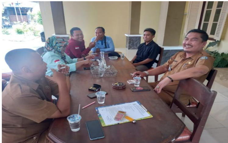
Gambar 1: pelaksanaan Planning pelaksanaan pengabdian

Masalah utama yang diidentifikasi adalah faktor ekonomi yang mendominasi prioritas keluarga, membuat pendidikan sering kali tidak dianggap sebagai kebutuhan mendesak. Sebagian besar penduduk bekerja sebagai buruh tani atau petani kecil dengan penghasilan yang hanya cukup untuk kebutuhan sehari-hari. Anak-anak sering kali dilibatkan dalam pekerjaan orang tua, sehingga waktu mereka untuk belajar menjadi terbatas. Di sisi lain, rendahnya tingkat pendidikan orang tua turut memengaruhi pemahaman mereka terhadap pentingnya pendidikan anak.