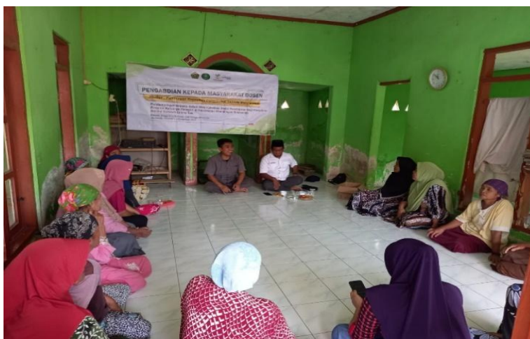
Gambar 2: pelaksanaan pengabdian kepada masyarakat

Pelaksanaan program “Sekolah Orang Tua” dilakukan dengan berbagai kegiatan yang dirancang untuk memberikan dampak langsung kepada masyarakat. Program dimulai dengan sesi edukasi yang membahas pentingnya peran orang tua dalam mendukung pendidikan anak. Materi yang diberikan mencakup topik-topik seperti komunikasi efektif antara orang tua dan anak, cara menciptakan lingkungan belajar yang kondusif di rumah, dan pentingnya memberikan motivasi kepada anak. Edukasi ini bertujuan membangun kesadaran dasar dan memperkuat pemahaman orang tua mengenai tanggung jawab mereka.