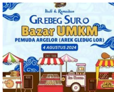
Gambar. 1.3 dan 1.4 hasil produk pelatihan dengan menggunakan aplikasi canva

Kegiatan pelatihan ini di mulai sejak awal Agustus hingga September dengan tema pemanfaatan desain Grafis yang dipadukan dengan media sosial. Pada awalnya para pemuda tidak memperdulikan pelatihan ini namun berjalan