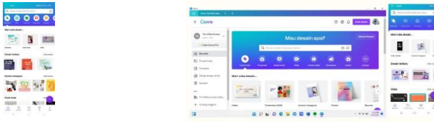
Gambar. 1.5 dan 1.6 tampilan canva di HP dan di PC