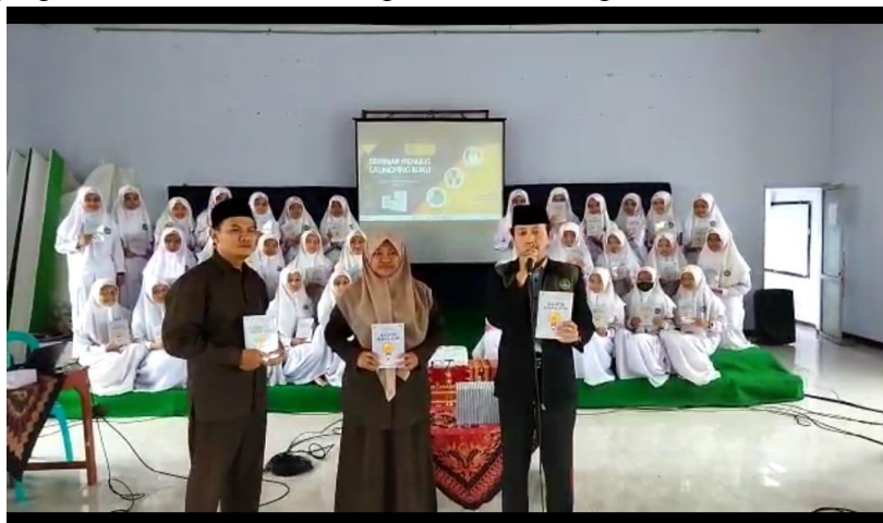
Gambar 3. Launching buku bersama semua penulis

Hasil pendampingan, baik berupa buku antologi maupun pengalaman pembelajaran, didiseminasi kepada siswa, pendidik, dan masyarakat luas. Diseminasi dilakukan melalui presentasi, pameran, publikasi, dan kegiatan lainnya untuk berbagi pengalaman dan memperluas pemahaman tentang manfaat pendampingan menulis buku antologi dalam meningkatkan literasi siswa.