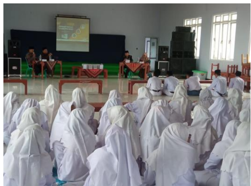
Gambar 1 dan 2. Pelaksanaan Pendampingan dalam bentuk seminar