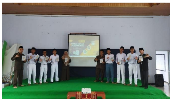
Gambar 4 dan 5. Foto Bersama setelah launching